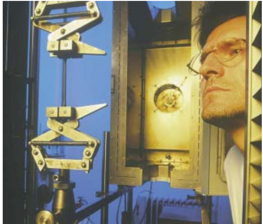
Abb. 3: Das DVGW-Prüfzeichen garantiert geprüfte Qualität

Im Zuge der Globalisierung und des zunehmenden Wettbewerbs in der Versorgungsbranche wird der Kostendruck weiter zunehmen. Die Gefahr, dass dabei Qualität und Sicherheit in den Hintergrund gedrängt und vordergründige Kostenvorteile bevorzugt werden, liegt auf der Hand. Gleichzeitig nimmt die Eigenverantwortung durch zunehmende Liberalisie-